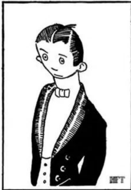
How you really look.