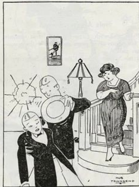
As She Is