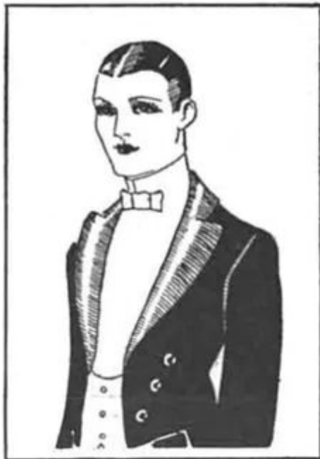
How you think you look when a flashlight is taken.