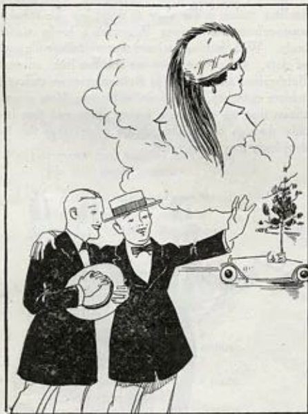
As Your Roommate Describes Her